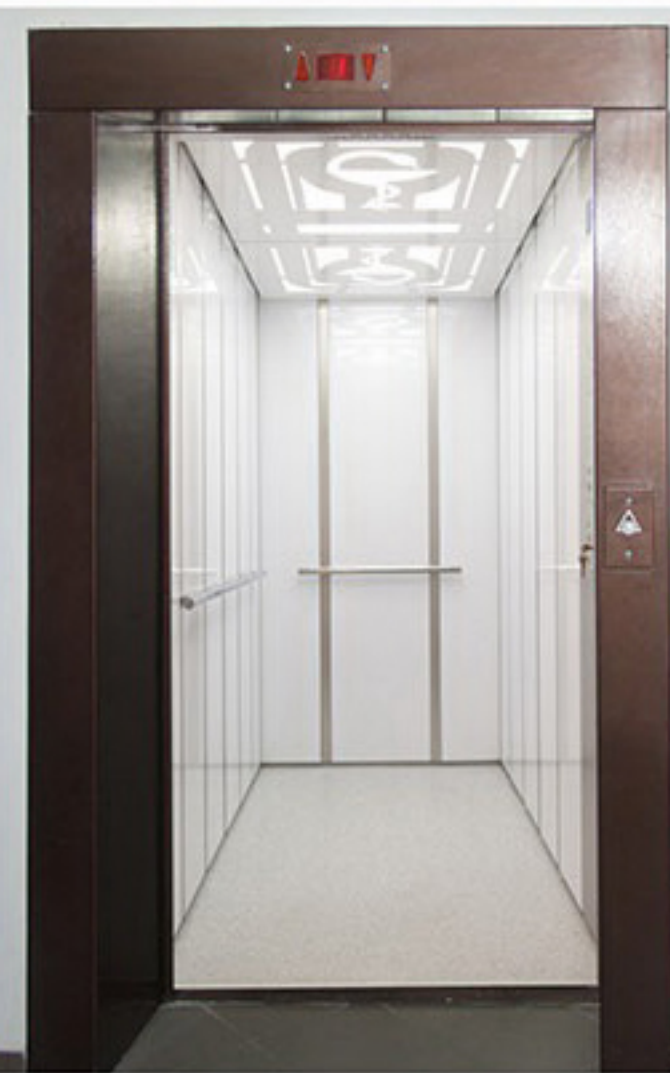
ЭМНЭЛГИЙН ЗОРИУЛАЛТТАЙ ЛИФТУУД