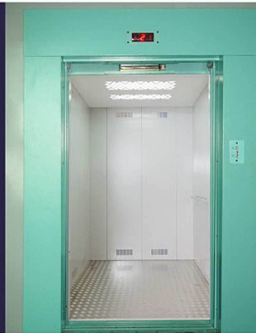
АЧАА ТЭЭВРИЙН ЛИФТУУД