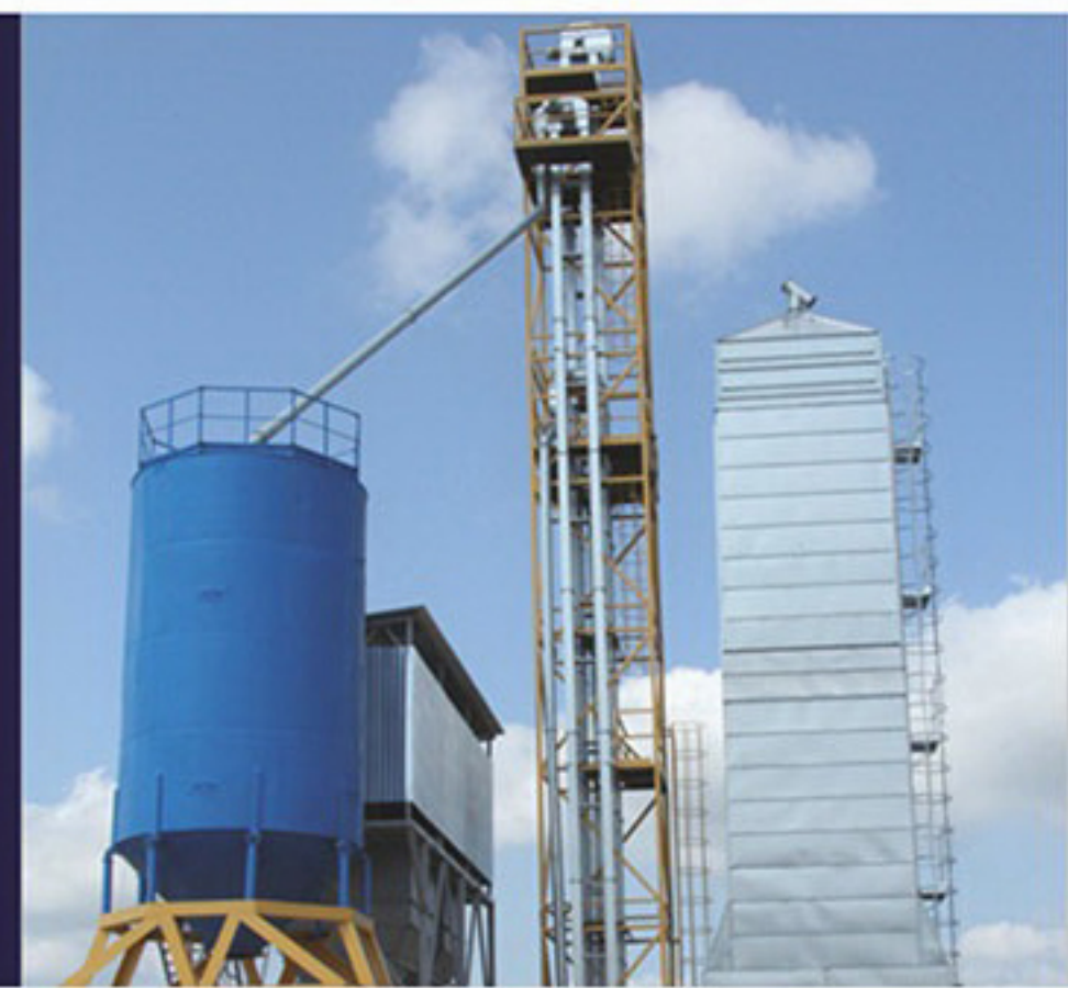
ХӨДӨӨ АЖ АХУЙН ТЕХНИК